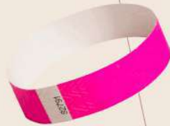
Realización & Producción