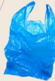
Marcas & Tendencias